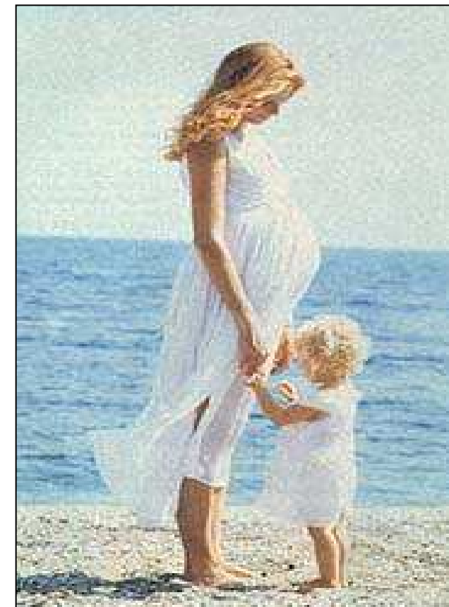
BABY NUOTO - GESTANTI

Eventuali assenze possono essere recuperate ( max. 2 recuperi ) nei corsi di acquaticità con posti disponibili, entro la scadenza dell'abbonamento stesso. Dal momento della prenotazione del recupero non sarà più possibile disdirlo. ( da concordare in segreteria)