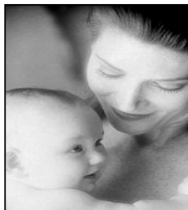
IL BENESSERE DELLA MAMMA E' IL BENESSERE DEL BAMBINO